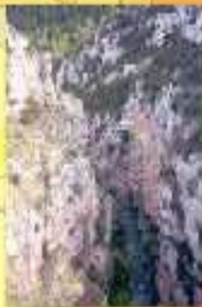
El perfil del trazado